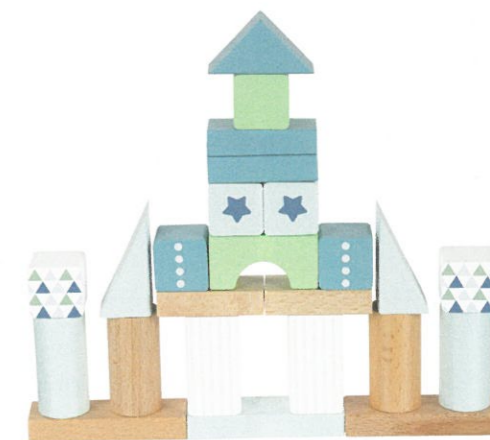
Das neue „Baustein-Set“ enthält 50 Bausteine und kommt in den Farben Aqua und Beere – hier zu sehen ist die Farbvariante Aqua

Der „Zug Stockholm“ – hier in der Farbvariante Beere – begeistert neben dem tollen Look auch mit seiner hohen Qualität