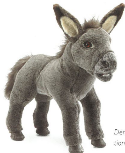
Der kleine Esel wirkt durch seine abgeänderten Proportionen wie ein süßes Jungtier

Spielen macht Spaß und dient der kindlichen Entwicklung – das gilt auch und gerade jetzt in diesen Zeiten. So hält Folkmanis-Puppets gleich 19 neue Artikel bereit, die ab Herbst in die Läden kommen. Eins davon ist das kleine Häschen „Grey Bunny Rabbit“