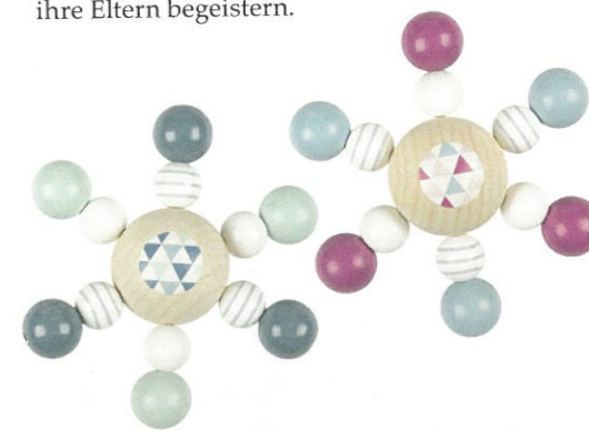
Auch der Greifling Perlenkreisel von Heimess ist in aktuellen Farbvarianten erhältlich – im Herbst folgt die neue Kollektion

durch eine neue Kollektion im Herbst ersetzt werden. Immer wieder neue Farbwellen werden die Kleinen und auch ihre Eltern begeistern.