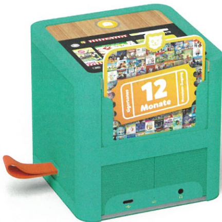
Ein 12-Monats-Tigerticket sowie ein Sammelalbum für die Tigercards zählen zu den Neuheiten für 2020.